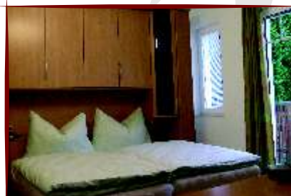
Alle Zimmer sind mit Bad und WC

Preise pro Tag und Person: Doppelzimmer DU/WC u. Frühstück: € 29,- pro Person jede weitere Nacht nur: € 24,50 pro Person Kinder bis 3 Jahre frei Kinder ab 3 Jahre 50 % Preise incl. 10% MwSt; Ohne Ortstaxe