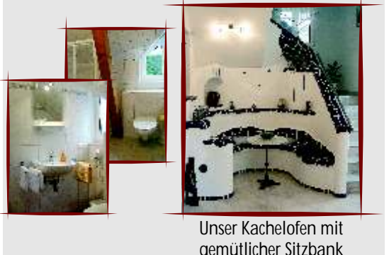
Unser Kachelofen mit gemütlicher Sitzbank

Das Therapiezentrum im Hotel und Moorbad Kloster Schwanberg bietet wirkungsvolle Moortherapien und Behandlungen unter kurärztlicher Aufsicht an. Das einzigartige Hochmoor von Garanas erzielt erstaunliche Effekte: Die Wärme entspannt Muskeln sowie Gelenke und bringt den gesamten Organismus ins Gleichgewicht. Der Körper wird auch entgiftet. Die Haut wird straff und weich wie ein Pfirsich. Durch die Wirkung auf die inneren Organe werden Moorbäder auch nach operativen Eingriffen oder bei einer Therapie begleitenden Behandlung des rheumatischen Formenkreises geschätzt. Das Hotel & Moorbad im ehemaligen Kapuzinerkloster Schwanberg liegt am Rande des Koralm-Massivs, inmitten der Schilcherweinstraße, in einer heilen Kulturlandschaft. Viele Heilsuchende genießen hier die harmonische, kraftvolle Ausstrahlung des alten Gemäuers und das naturbelassene Umfeld mit der einzigartigen Moosstecherei.